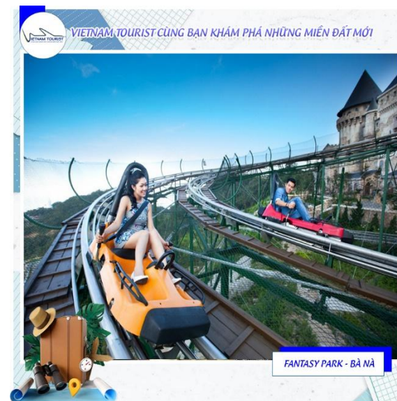
FANTASY PARK - BÀ NÀ