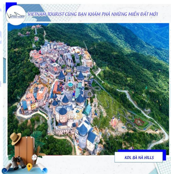
KDL BÀ NÀ HILLS

Quý khách tiếp tục tham gia các trò chơi tại một trong công viên giải trí tâm cỡ khu vực Fantasy