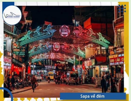
Sapa về đêm