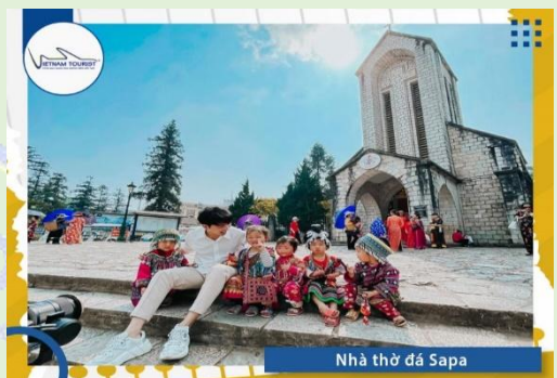
Nhà thờ đá Sapa