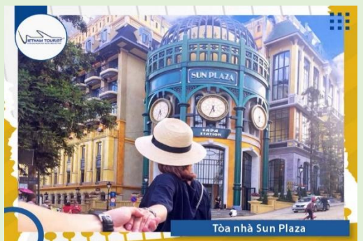
Tòa nhà Sun Plaza